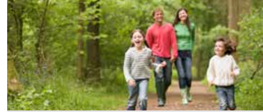
Stabroek doet je een bos cadeau p.3