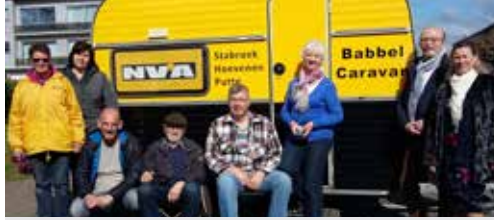
Kom naar onze Babelcaravan! p.2